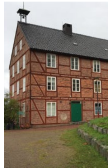
Pappers bruket i Östana