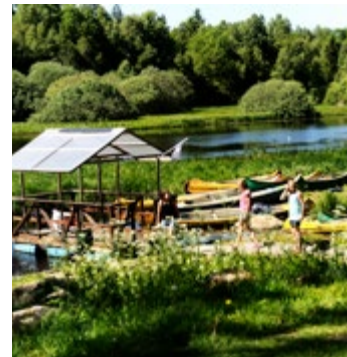
Denningarums gård.

Hjälmen är lika viktig för cyklisten som bilbältet är för bilisten. Enligt lag ska alla under 15 år bära hjälm när de cyklar eller blir skjutsade.