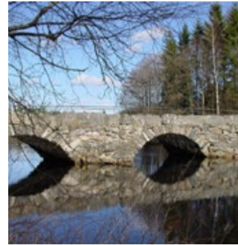
Stenvalvsbron i Glimminge