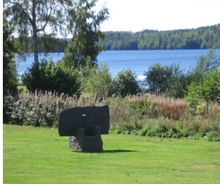
Diabasskulptur i Breanäs

I T-korset tar du till vänster på asfalten mot Knislinge. Du cyklar ungefär 1 km och tar sedan till höger vid skylt mot Hjärsås.