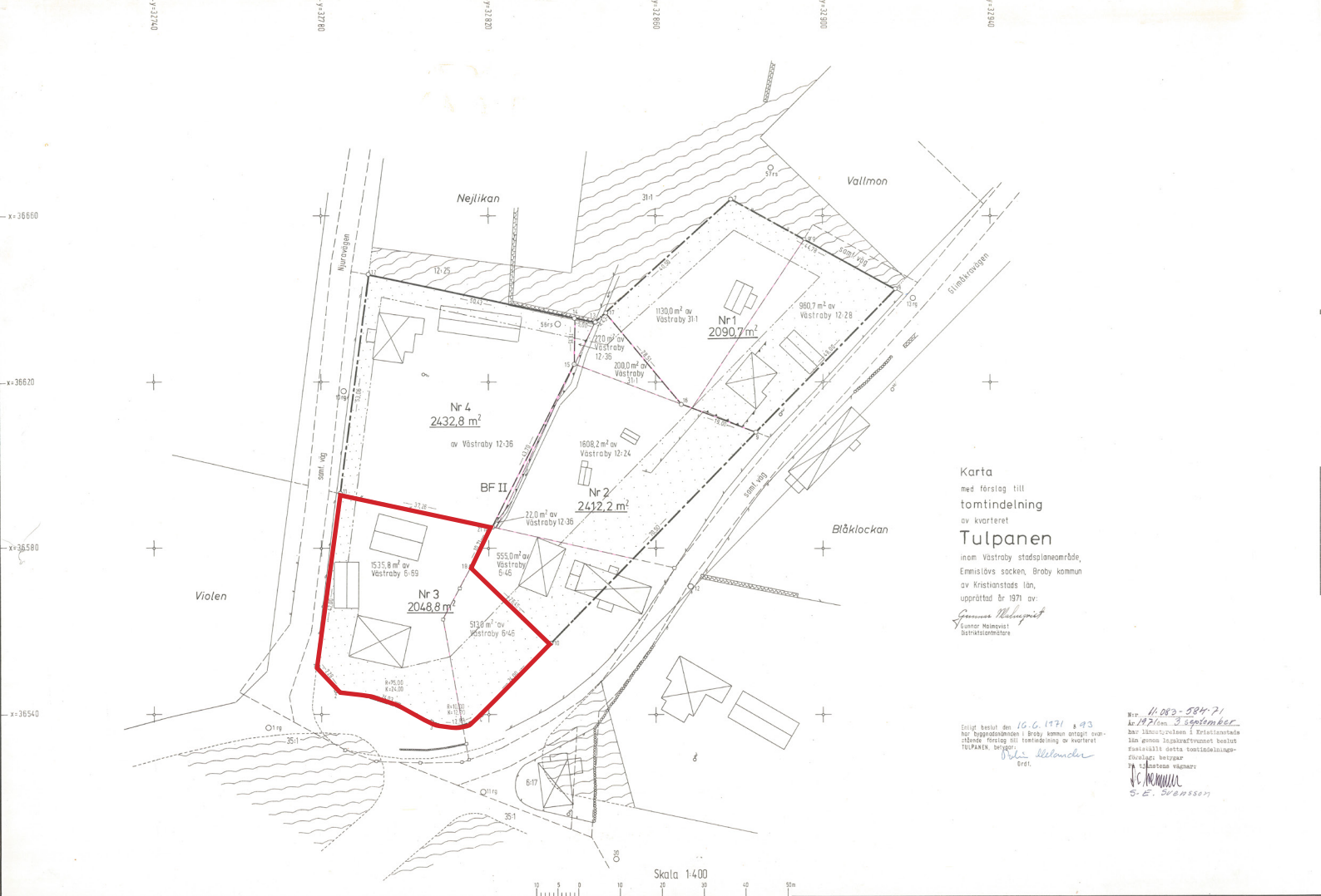
Utdrag ur gällande tomtindelningsplan (aktnummer 11-VBY-21/71). Aktuellt område där tomtindelningen upphävs är rödmarkerat.