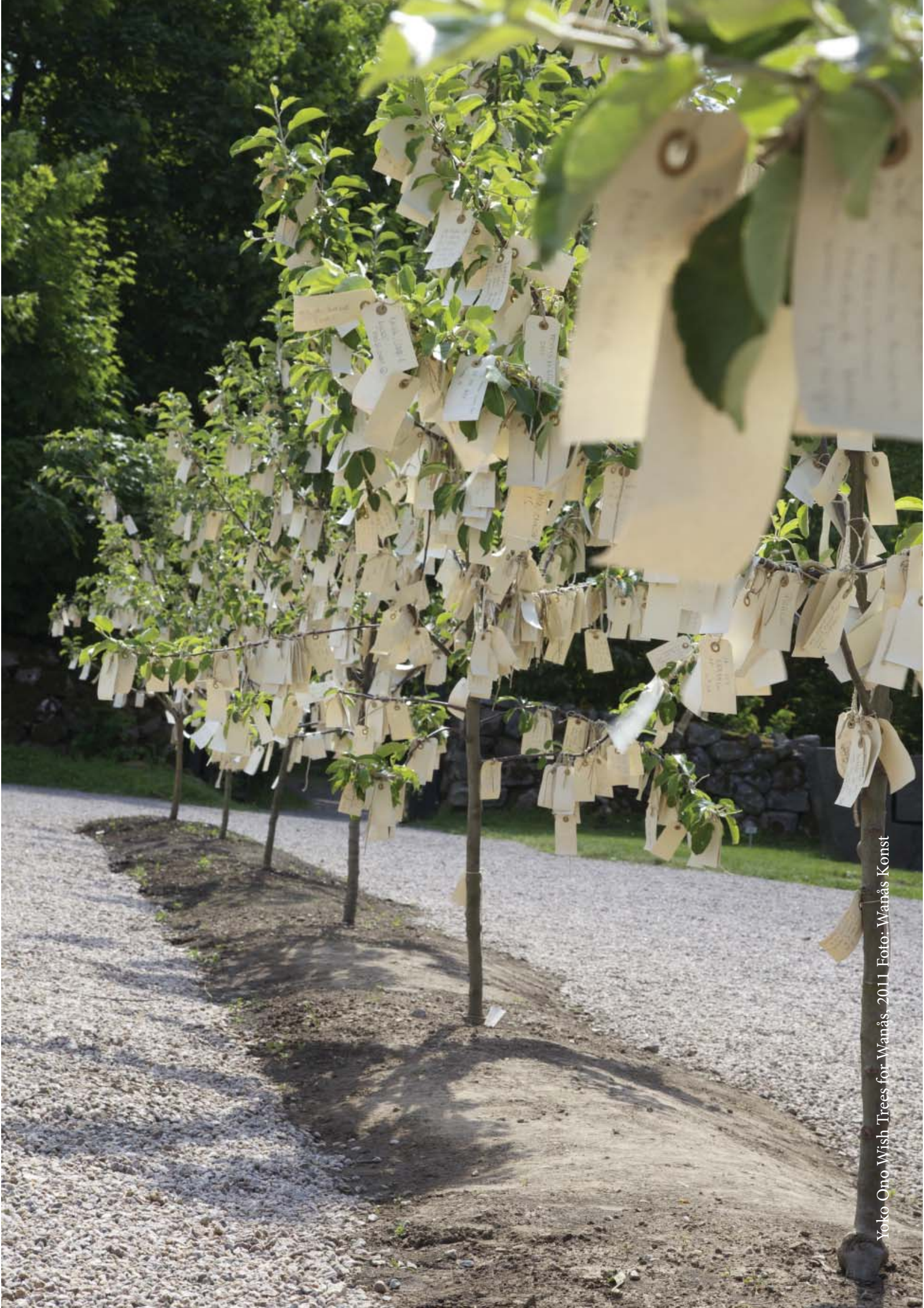
Yoko Ono Wish Trees for Wanås, 2011.